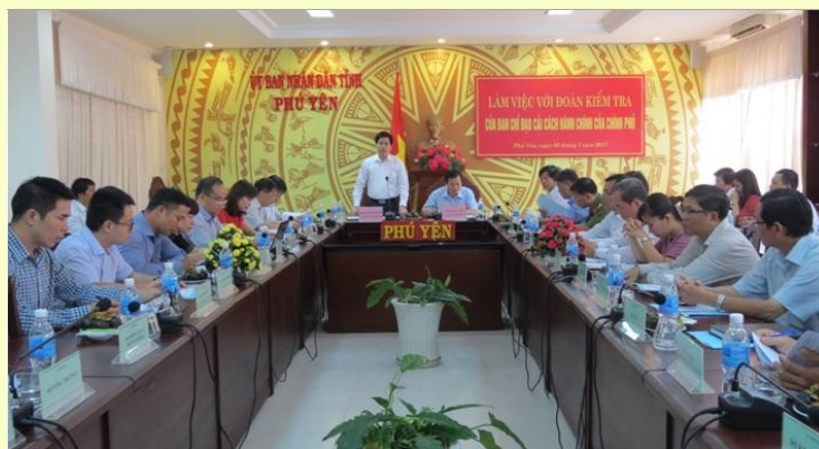
Toàn cảnh buổi làm việc