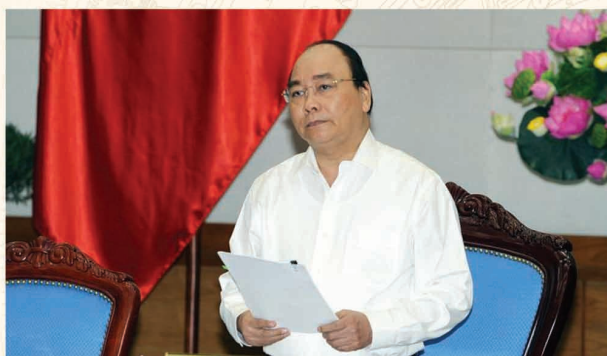
Thủ tướng Chính phủ phát biểu kết luận tại phiên họp Chính phủ thường kỳ

"Vấn đề tỉnh này tỉnh kia, bí thư này chủ tịch nọ đưa người nhà vào trong hệ thống là cực kỳ nguy hiểm, mất uy tín với dân... Tôi mong các bộ, viện, sở, vụ gương mẫu, tìm người tài, hiền đức chứ không phải tìm người nhà mình cho các vị trí", Thủ tướng Chính phủ nhấn mạnh.