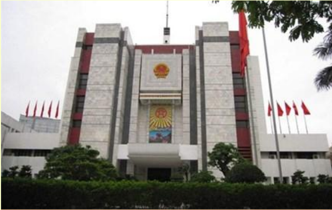
Hà Nội đã cơ bản hoàn thành công tác rà soát, sắp xếp, kiện toàn tổ chức bộ máy