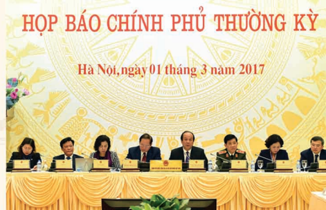
Các đồng chí lãnh đạo các bộ, ngành chủ trì phiên họp báo Chính phủ thường kỳ tháng 2/2017

Mở đầu phiên họp báo, Bộ trưởng Mai Tiến Dũng thông báo vắn tắt về nội dung phiên họp thường kỳ Chính phủ tháng 2/2017 diễn ra cùng ngày dưới sự chủ trì của Thủ tướng Chính phủ Nguyễn Xuân Phúc.