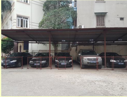
5 xe biển xanh của Sở Lao động, Thương binh và Xã hội Hà Nội được niêm phong chờ hướng xử lý của thành phố

Ông Vinh cho hay, trong các xe thu hồi, có những xe hạng sang sản xuất vào khoảng năm 2010, do vậy cần có giải pháp đảm bảo thanh lý sát với giá trị thực của phương tiện. Ngoài ra, để tránh việc mạo danh, các xe này sẽ bị thu hồi biển và giấy tờ trước khi chuyển chủ.