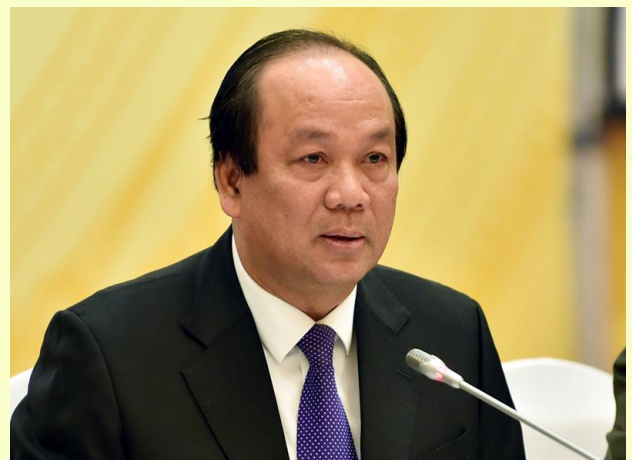
Bộ trưởng, Chủ nhiệm Văn phòng Chính phủ Mai Tiến Dũng trả lời câu hỏi của báo chí

Bộ trưởng Mai Tiến Dũng: Cảm ơn báo chí quan tâm vụ việc hết sức cá biệt, nhưng cũng rất đáng tiếc tại Trường Tiểu học Nam Trung Yên vừa qua. Có thể nói, vụ việc này là cá biệt, nói là nhỏ nhưng cũng không hề nhỏ, vì động chạm đến đạo đức của người thầy. Việc này thu hút sự quan tâm rất lớn của các gia đình, các cháu học sinh, dư luận, ảnh hưởng uy tín ngành giáo dục, lòng tin với người thầy.