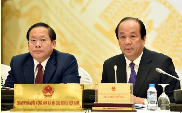
Bộ trưởng, Chủ nhiệm Văn phòng Chính phủ, Người phát ngôn của Chính phủ Mai Tiến Dũng và Bộ trưởng Bộ Thông tin và Truyền thông Trương Minh Tuấn chủ trì cuộc họp báo Chính phủ

Đáng chú ý, trong dự thảo Luật Quản lý nợ công, vấn đề được dư luận quan tâm là phạm vi nợ công. Các thành viên Chính phủ thống nhất phạm vi nợ công gồm nợ Chính phủ, nợ được Chính phủ bảo lãnh, nợ của chính quyền địa phương, không bao gồm nợ tự vay tự trả của doanh nghiệp nhà nước, nhằm bảo đảm bình đẳng giữa các doanh nghiệp thuộc các thành phần kinh tế.