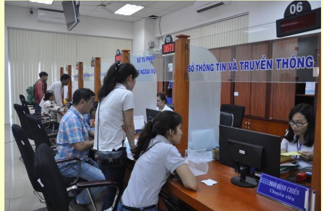
Trong tháng 6 và tháng 7/2017 sẽ thí điểm kiểm tra sát hạch đối với công chức tại các cơ quan chuyên môn thuộc UBND tỉnh Bà Rịa - Vũng Tàu. Trong ảnh: người dân đến làm thủ tục tại bộ phận tiếp nhận và trả kết quả tập trung thuộc Văn phòng UBND tỉnh Bà Rịa - Vũng Tàu

“Việc sát hạch những vị trí chủ chốt là hết sức cần thiết để làm tốt hơn công tác nhân sự. Biết được cán bộ của mình thiếu, yếu ở những điểm gì để bổ sung, sửa chữa sớm” - ông Linh nói.