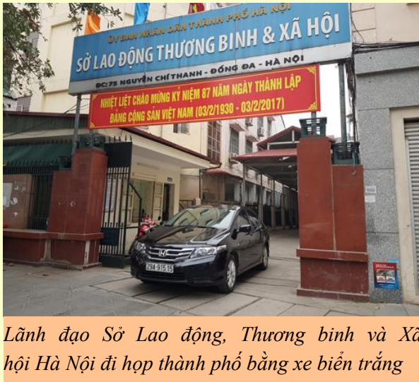
Lãnh đạo Sở Lao động, Thương binh và Xã hội Hà Nội đi họp thành phố bằng xe biển trắng

S áng ngày 01/3, 8 đơn vị của thành phố Hà Nội bắt đầu thực hiện chủ trương khoán xe công, trên 40 xe biển xanh được niêm phong chờ điều chuyển hoặc đấu giá.