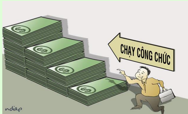
Minh họa: Ngọc Diệp

Tham nhũng vặt, hạch sách, quan liêu, bòn rút tiền người dân, doanh nghiệp, trục lợi chính sách, “đục khoét” ngân sách - bao nhiêu vụ thất thoát trăm tỷ, nghìn tỷ cũng từ đó mà ra. Nó mặc nhiên như một quy luật về sự đánh đổi. Dù tình trạng này không mang tính đại diện nhưng lại rất nhức nhối, khó loại bỏ trong ngày một, ngày hai.