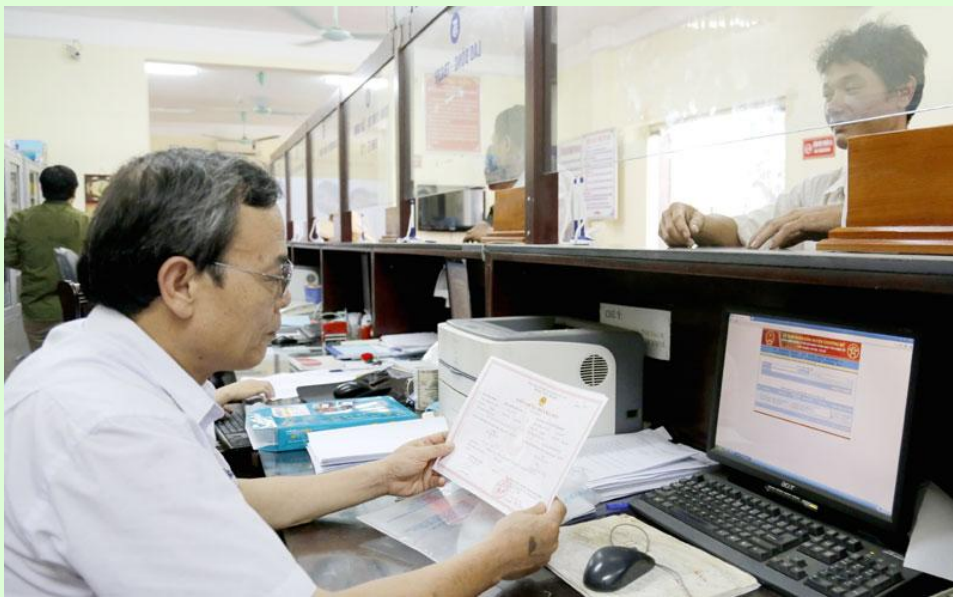
Cán bộ Bộ phận một cửa huyện Chương Mỹ giải quyết thủ tục hành chính cho người dân

Thực hiện Nghị quyết số 39-NQ/TW của Bộ Chính trị về TGBC, thời gian qua, các cấp, các ngành đã và đang có những bước đi khá quyết liệt, thực tế nhằm đạt được mục tiêu đến năm 2020 giảm được 10% tổng biên chế được giao. Theo thống kê của Bộ Nội vụ, tính đến ngày 15/12/2016, có 49 lượt bộ, ngành và 149 lượt địa phương đề nghị thẩm tra các phương án TGBC năm 2015, 2016 và 2017, với tổng số tinh giản 21.247 người. Trong đó, các cơ quan của Đảng, đoàn thể là 880 người; các cơ quan hành chính 2.643 người; các đơn vị sự nghiệp công lập 13.694 người; cán bộ, công chức cấp xã 3.913 người; DN Nhà nước 117 người.