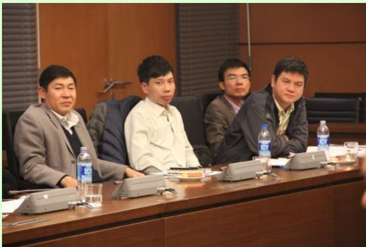
Các thành viên tham dự phiên họp chiều 18/1

Theo bà Khánh, vấn đề này dư luận đặc biệt quan tâm tuy nhiên chúng ta đang gặp khó khăn khi Luật chưa có quy định cụ thể về biện pháp xử lý đối với những lãnh đạo, cán bộ đã nghỉ hưu.