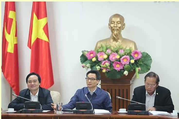
Phó Thủ tướng Vũ Đức Đam chủ trì cuộc họp

Những xu thế chính của Chính phủ điện tử trên thế giới là tích hợp và liên thông các dịch vụ công trực tuyến; dữ liệu mở; sự tham gia của người dân vào quản lý điều hành của cơ quan công quyền và các công nghệ số, đặc biệt là các công nghệ di động.